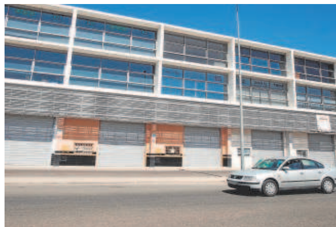
Naves cerradas en el polígono industrial de La Torrecedal (Córdoba)

dejarlas en una situación vulnerable tras el verano, ante la expectativa de recesión y subida de tipos de interés.